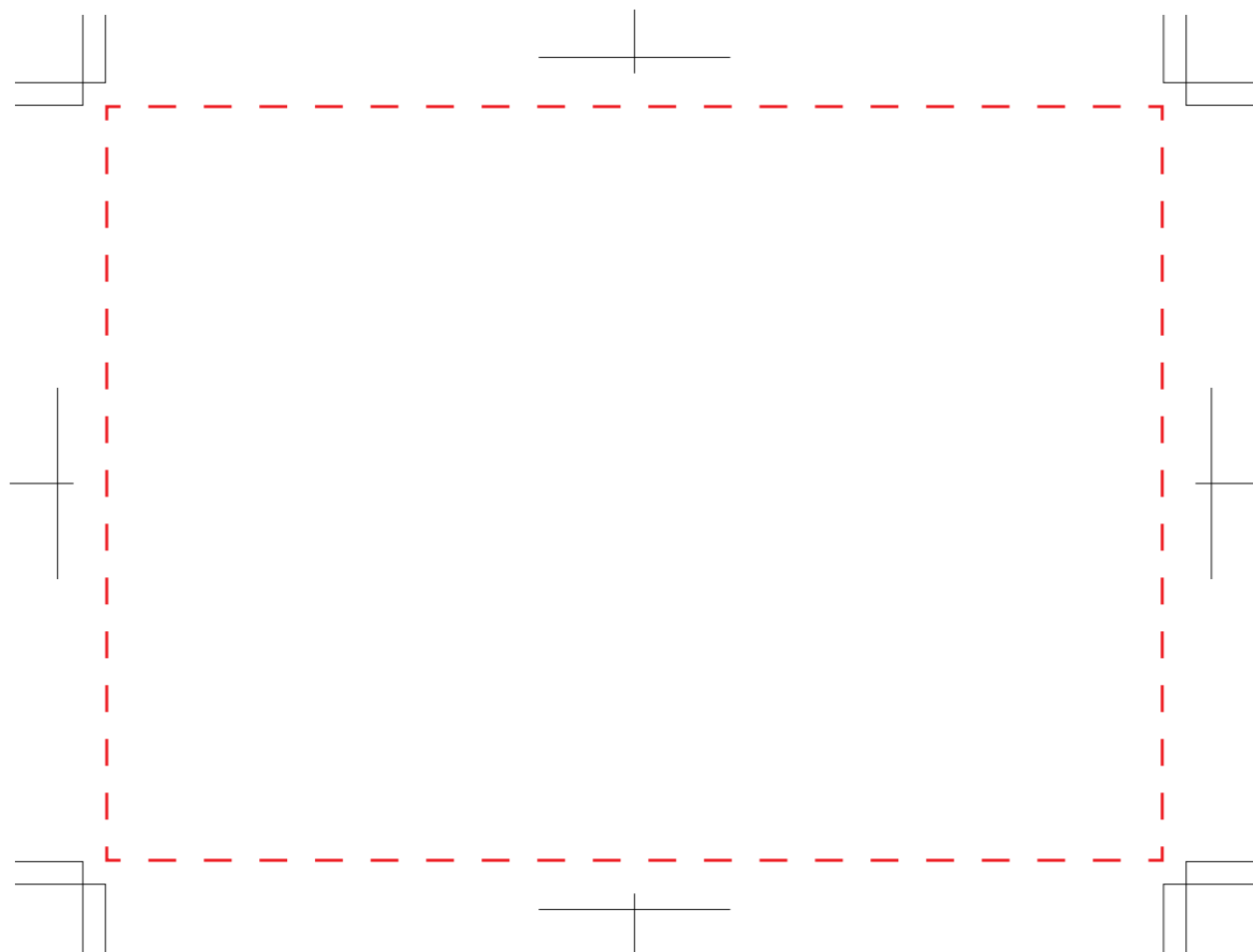
印刷範囲/側面 (ワイド) W140×H100mm