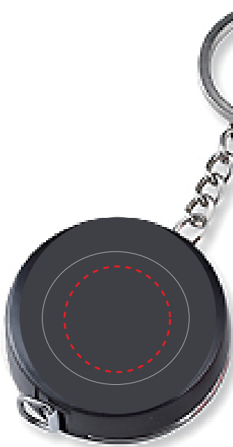
ブラック 40 個