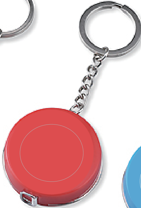
レッド 20 個