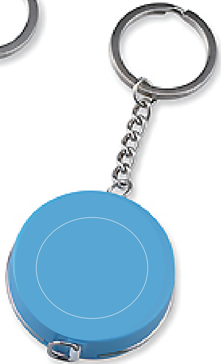
ブルー 40 個