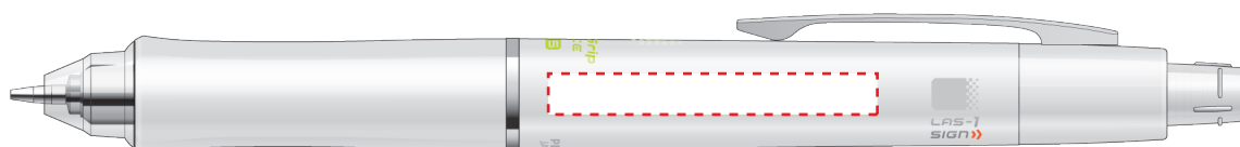
HDGAC-80R-GSP グラデーションソフトピンク