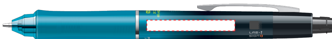
HDGAC-80R-GTL グラデーションターコイズブルー