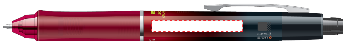
HDGAC-80R-GR グラデーションレッド