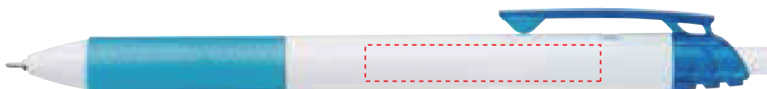
BLN125WSAN【白軸】スカイブルー