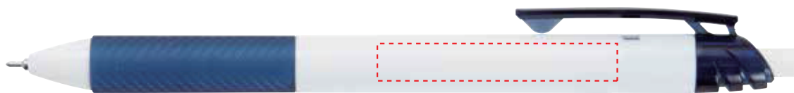
BLN125WCAAN【白軸】ブルーブラック