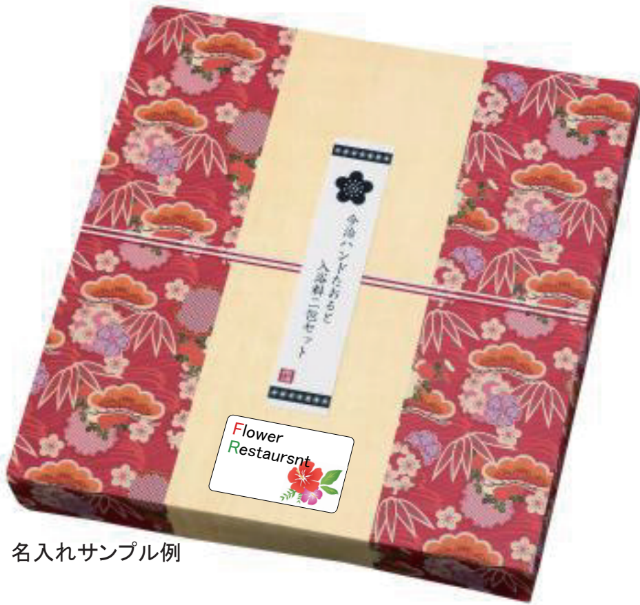
名入れサンプル例