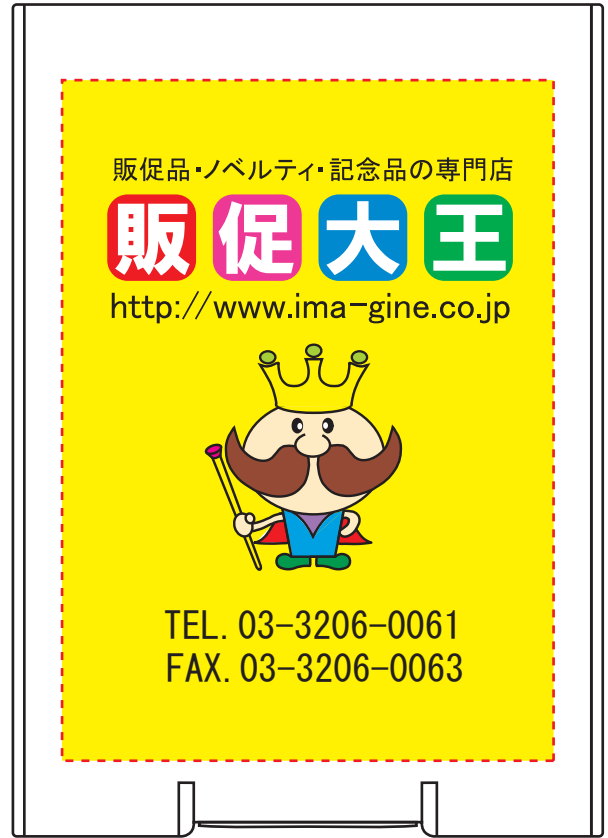
フルカラー名入れ例